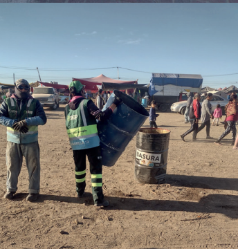
Conmemoración del aniversario 447 de la ciudad (plaza fundadores)