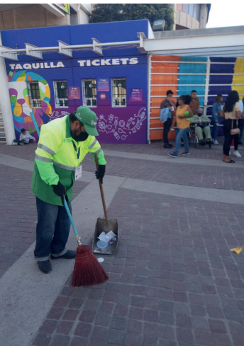
Feria Estatal de León 2023