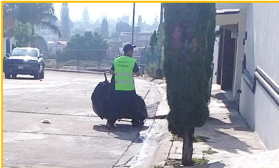
Imagen No. IV.3.6.3. Recuperador registrado por el SIAP.