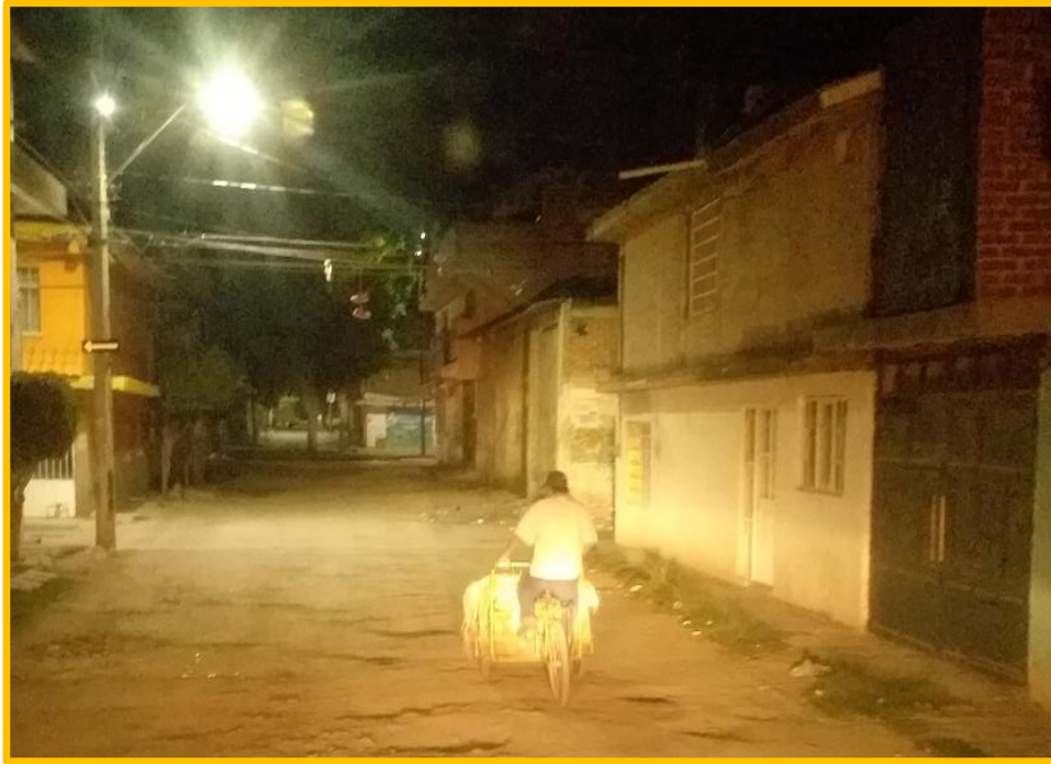
Imagen No. IV.3.6.5. Recuperador urbano realizando su labor en horas de la noche y en una zona popular.