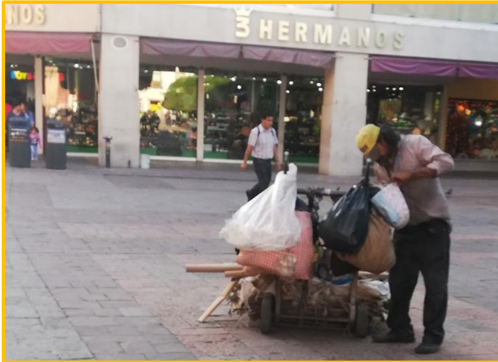
Imagen No. IV.3.6.2. Recuperador urbano en pleno centro de la ciudad, haciendo un alto en su recorrido, para asegurar los subproductos segregados en su carrito. Nótese el tipo de materiales que ha segregado.