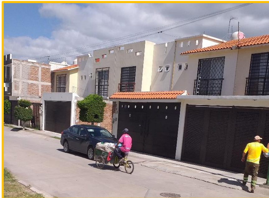
Imagen No. IV.3.6.6. Recuperador urbano realizando su labor por la mañana, justamente cuando se lleva a cabo la prestación del servicio de recolección, en un fraccionamiento.