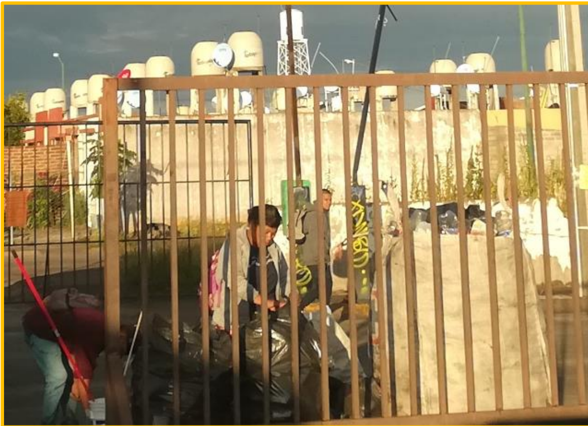
Imagen No. IV.3.6.1. Recuperadores urbanos abriendo bolsas conteniendo basura de casas-habitación y llenando sus arpillas con subproductos reciclables.

Los recuperadores son en todo caso, una forma de manifestación del sector informal, donde su zona natural de trabajo son las vialidades de la Ciudad de León, y su labor es la separación de residuos con valor comercial como son el papel, el pet, aluminio, cartón, para después comercializarlos al final la jornada.