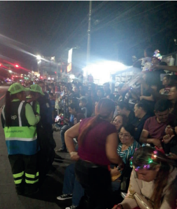
Mi Barrio Habla